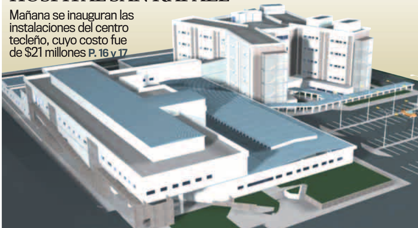
MAQUETA 3D EDH / CORTESÍA HOSPITAL SAN RAFAEL

Mañana se inauguran las instalaciones del centro tecleño, cuyo costo fue de $21 millones P. 16 y 17